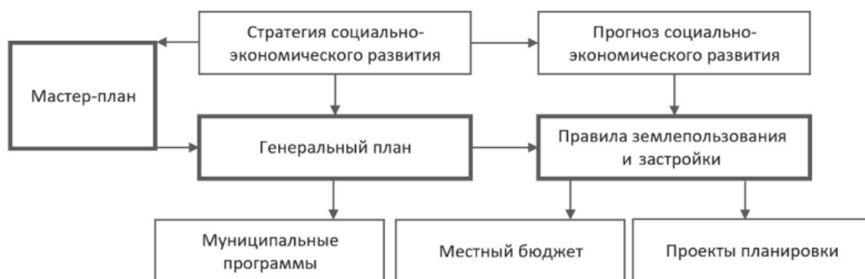
Рис. 1 Модель увязки стратегического и территориального планирования [1]

В конце XX и начале XXI века статичные генеральные планы доказали свою неспособность оперативно реагировать на реалии рыночной экономики и быстрые демографические скачки. Произошел сдвиг парадигмы от жесткого регулирования к стратегическому мастер-планированию. Современные генеральные планы больше не фиксируют детальную застройку каждого квартала, а задают гибкие правила игры и векторы развития (рис. 1).