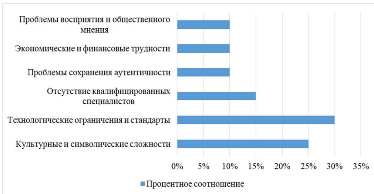
Рис. 1 Основные проблемы и вызовы при интеграции национальных мотивов

казахских мотивов в здания и городские пространства может стать важным аспектом в развитии туристической отрасли и привлечении иностранных инвестиций.