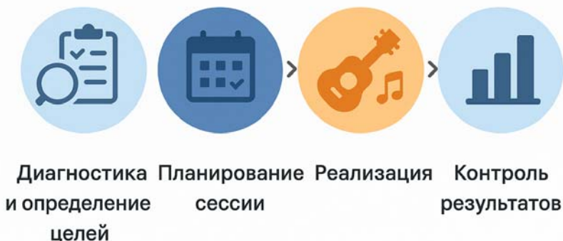
Рис. 1 Этапы терапевтического процесса