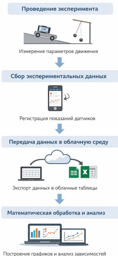
Рис. 1 Схема организации учебного исследования по механике с использованием смартфона и облачных технологий

традиционной структуре научного исследования и позволяет формировать у обучающихся навыки экспериментальной работы.