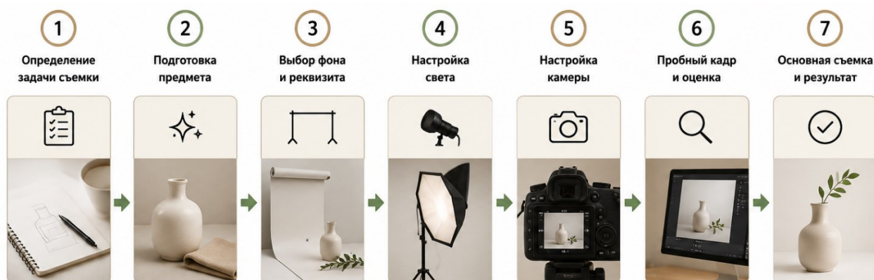
Рис. 3 Последовательность практической работы при предметной фотосъемке (разработка автора)

Последовательность практической работы при предметной фотосъемке показана на рисунке 3.