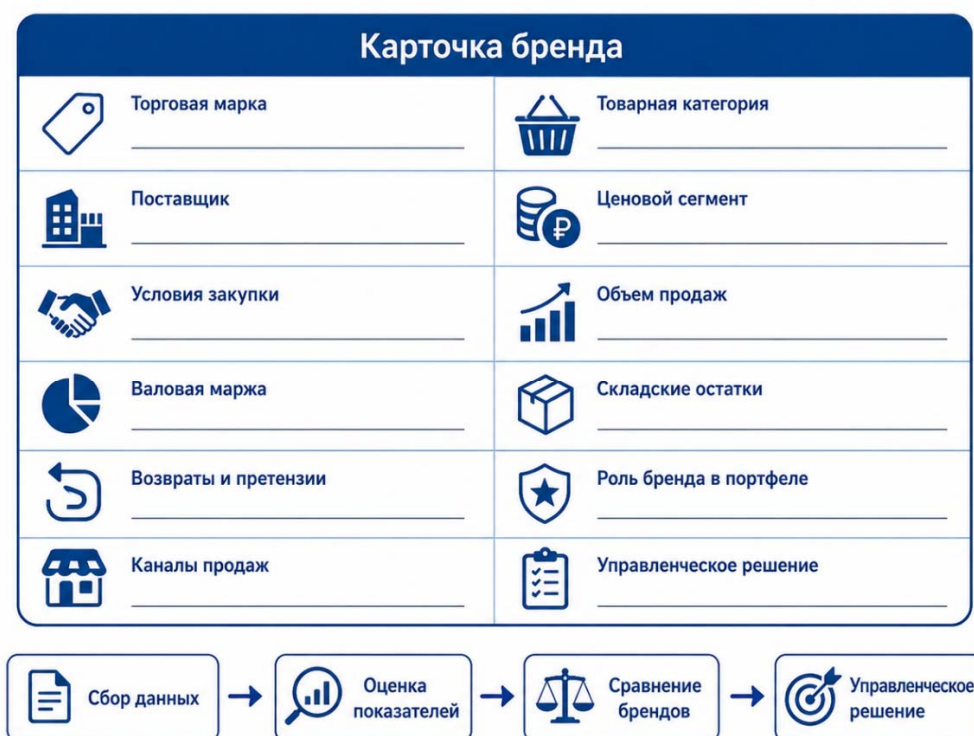
Рис. 2 Карточка бренда для портфельного управления

Следующим шагом должно стать введение карточки бренда (рисунок 2). В ней фиксируются ключевые сведения о торговой марке: товарная категория, поставщик, ценовой сегмент, условия закупки, роль бренда в портфеле, основные показатели эффективности и принятое управленческое решение. Такая карточка позволяет сравнивать бренды между собой и снижает риск субъективного выбора.