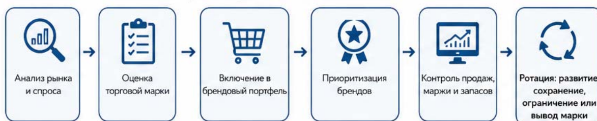
Рис. 1 Логика портфельного управления брендами в дистрибьюторской компании

Логика портфельного управления брендами в дистрибьюторской компании представлена на рисунке 1.